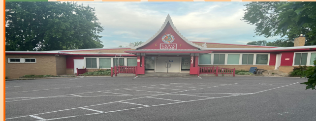
Lao Cultural Center Building ອາຄານຂອງສູນວັທະທັມລາວ (LCC).

2648 W Broadway Ave. Minneapolis, MN 55411 ຫ້ອງການຂອງອົງການລາວເພື່ອຄວາມກ້າວໜ້າໃນສະຫະຣັດ LAO ADVANCEMENT ORGANIZATION OF AMERICA (LAOA)